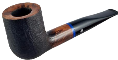
Wedstrijdpijp door Bróg Pipes

Op zondag 27 oktober is in Poznan, Polen, de WORLD Cup pijproken 2024. Alle informatie die u nodig heeft vindt u op de website https://www.fajka.org .