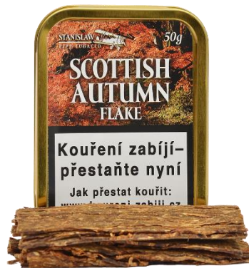
Tabak Stanislaw Pipe Tobacco Scottish Autumn